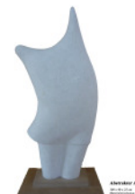
Wilhelm Tinnemann: Abstrakter Akt